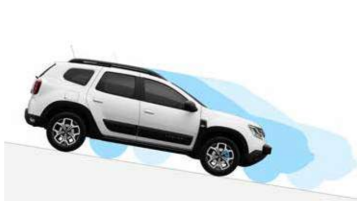
HDC - Asistencia al descenso en pendiente