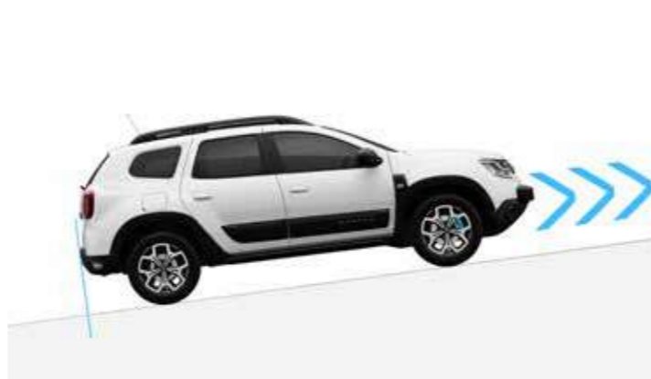
HSA - Asistencia al arranque en pendiente