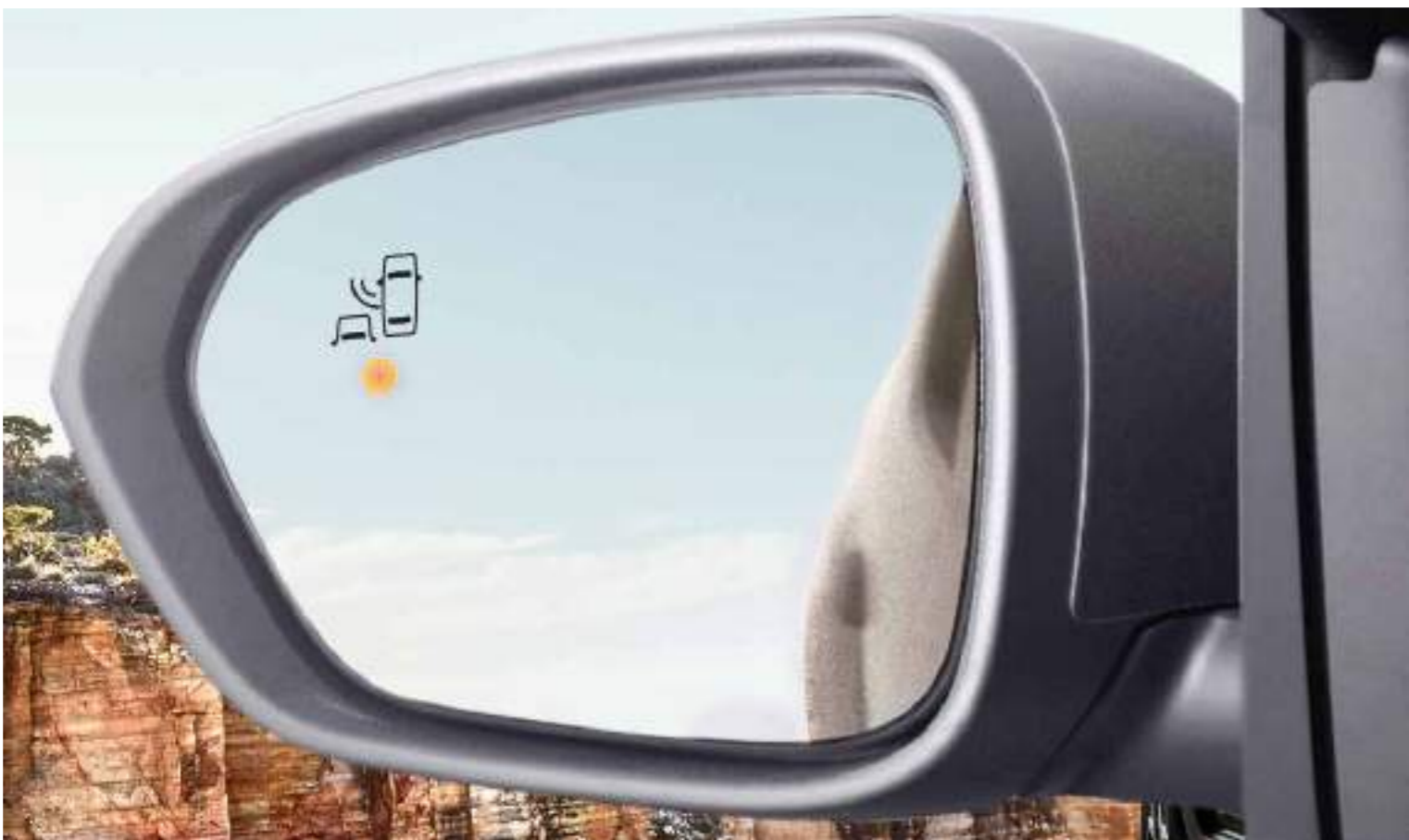
BSW - Sensor de punto ciego

El nuevo Renault Duster cuenta con un completo equipamiento tecnológico para mantener bajo control todas las variables de conducción y brindar la mayor seguridad a los pasajeros.