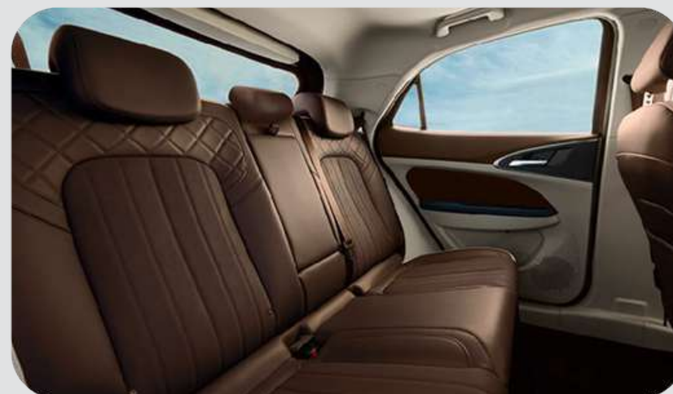
Café / Blanco