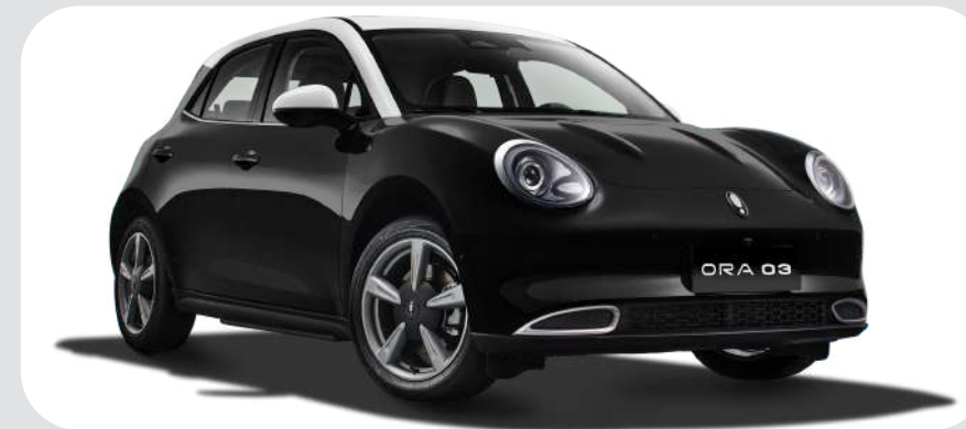
Midnight Black / Snow White