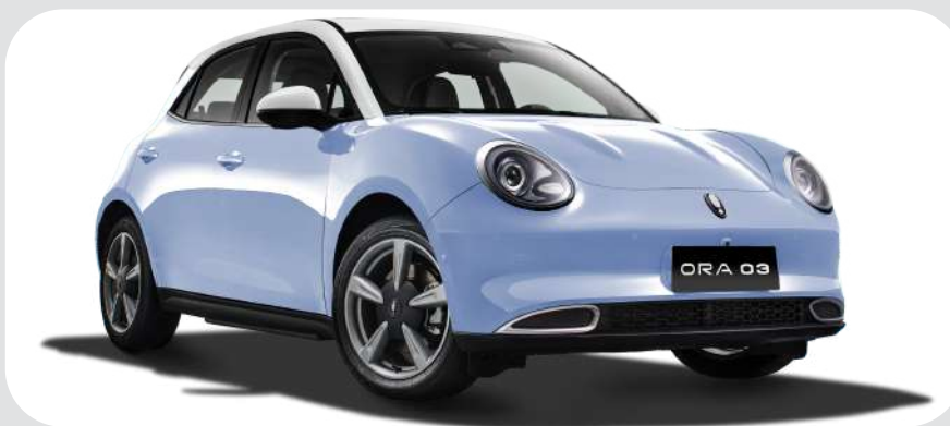
Light Blue/Snow White