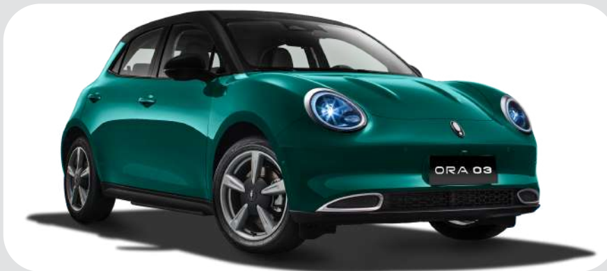
Emerald Green / Midnight Black