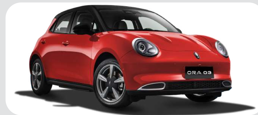
Mars Red / Midnight Black