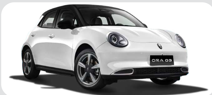
Snow White /Midnight Black