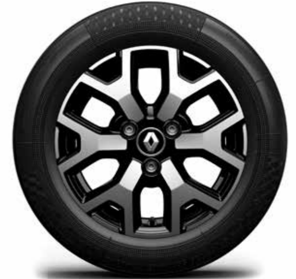
llanta de aleación diamantada 14" bitono

Las fotografías no son contractualmente vinculantes.